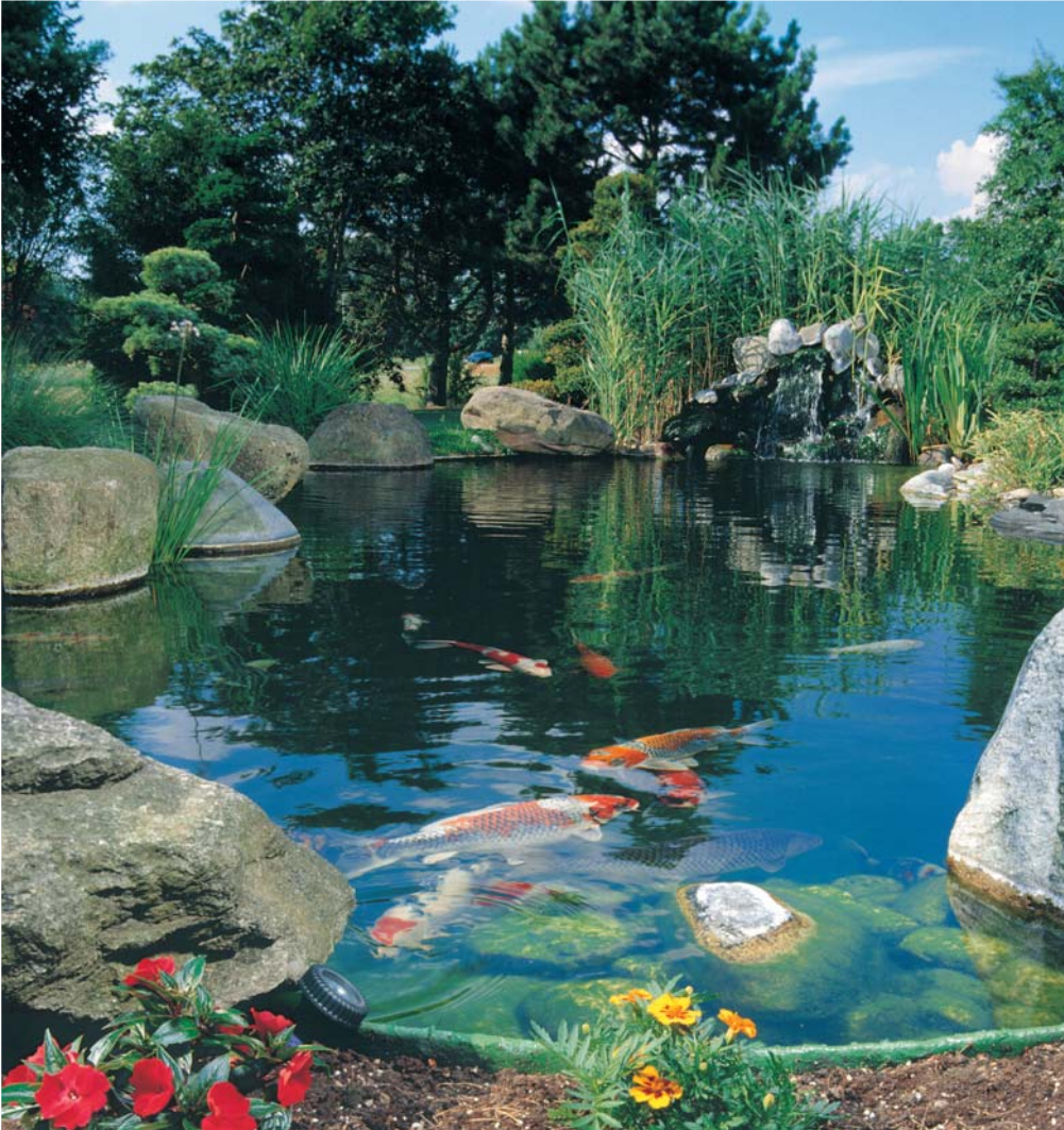
Titan-Wärmepumpen – auch zur Beheizung von Koi-Becken geeignet.